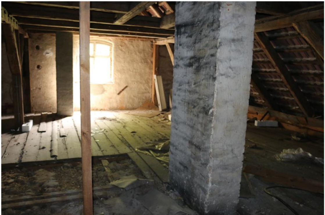
Dachboden vom Wohnhaus