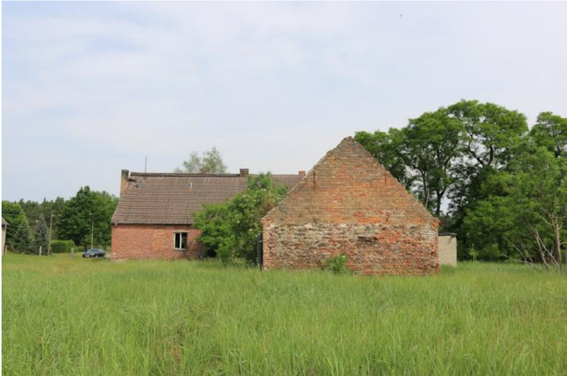
Stall und Wohnhaus