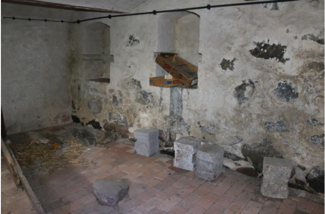
Keller vom Wohnhaus