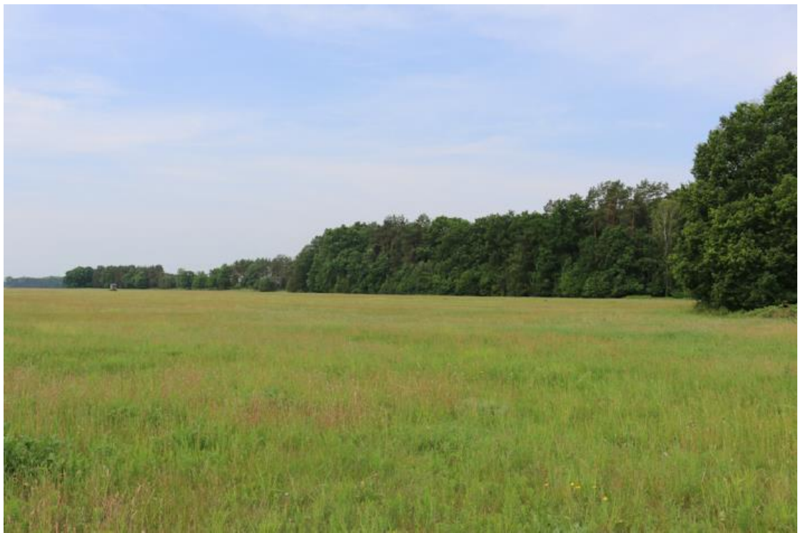
Ansicht von Osten