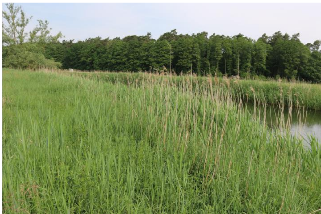
Ansicht von Osten